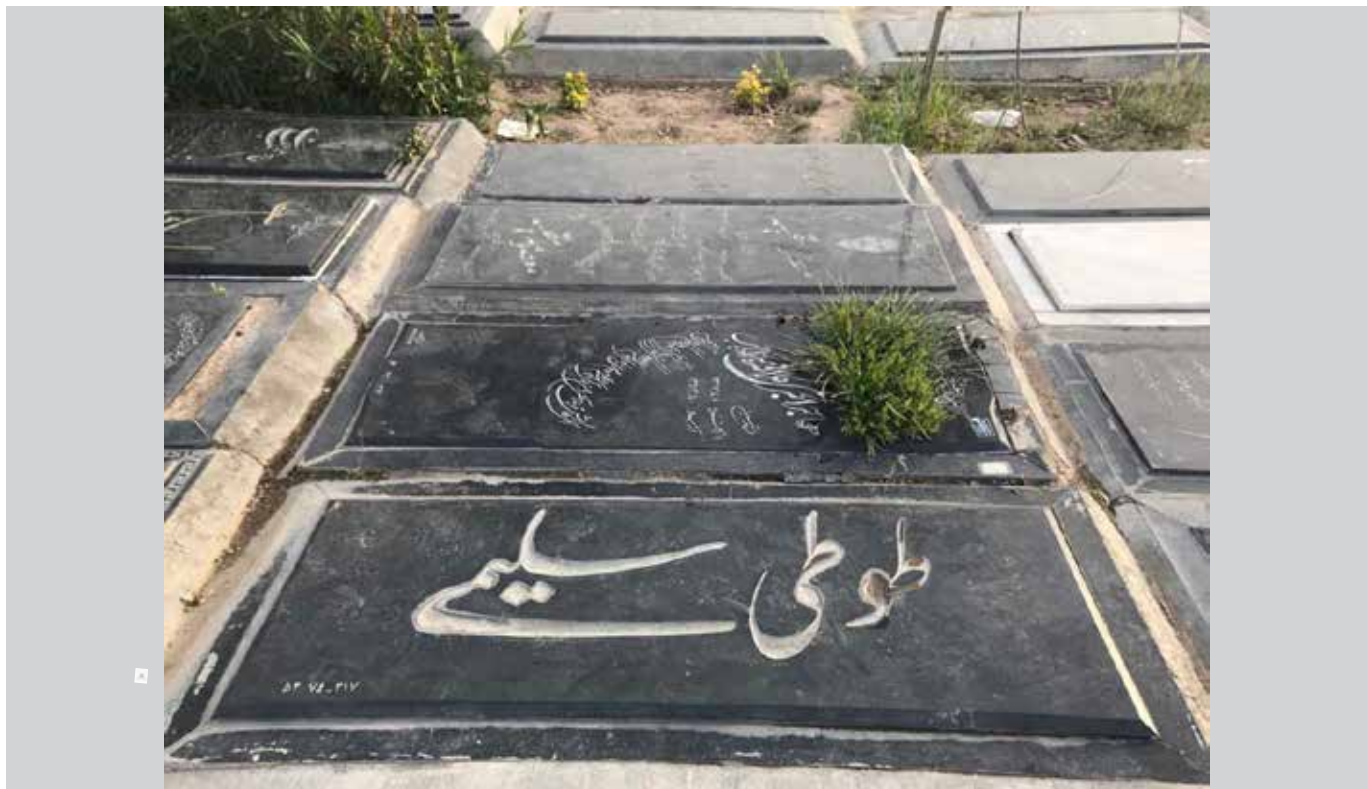
بهشت زهرا، قطعه ۳۷، ردیف ۷۴، شماره ۵۳