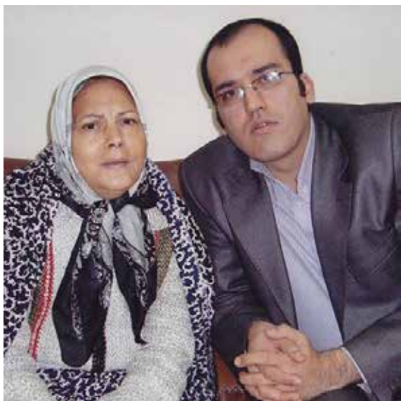
سازمان برای ترویج آوازه‌هاست فرمان عشق و باطنی از فرهنگ