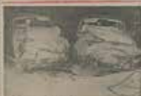
این حادثه در تهران رخ داد. در تصادم، چهار نفر کشته شدند. زن شاکی از سوختن بنزین شکایت کرد.

حادثه ای که در تهران رخ داد و در تصادم، چهار نفر کشته شدند. زن شاکی از سوختن بنزین شکایت کرد. این حادثه در تهران رخ داد و در تصادم، چهار نفر کشته شدند. زن شاکی از سوختن بنزین شکایت کرد.